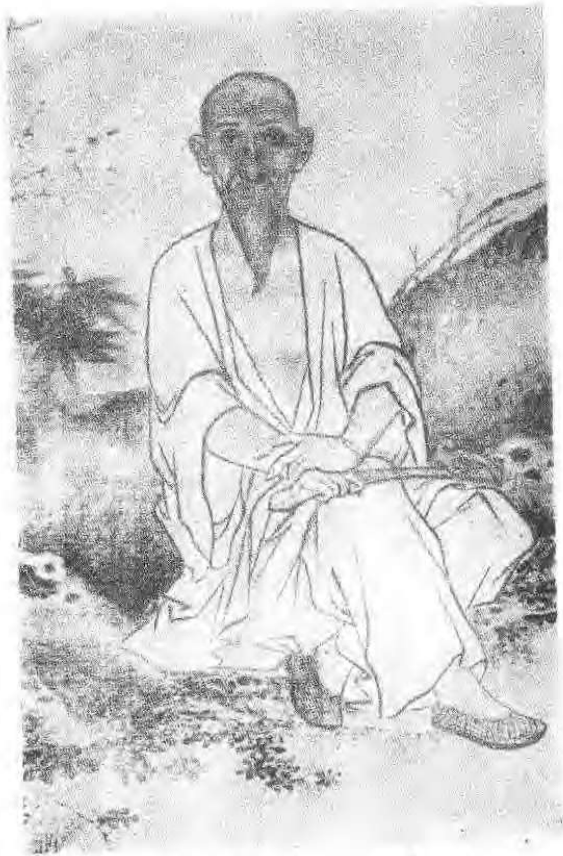
圖一 顧炎武像 禹之鼎繪 (據李平書《且頭老人自訂年譜》插頁複製)