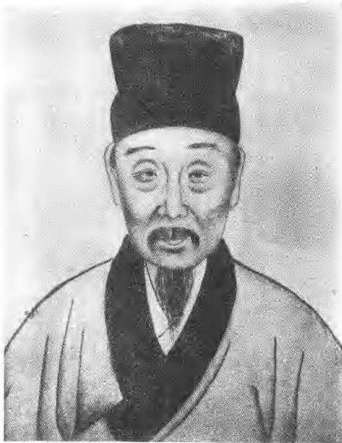
圖三 顧炎武像 崑山縣圖書館藏 (據《崑山明賢畫像傳贊》複製)